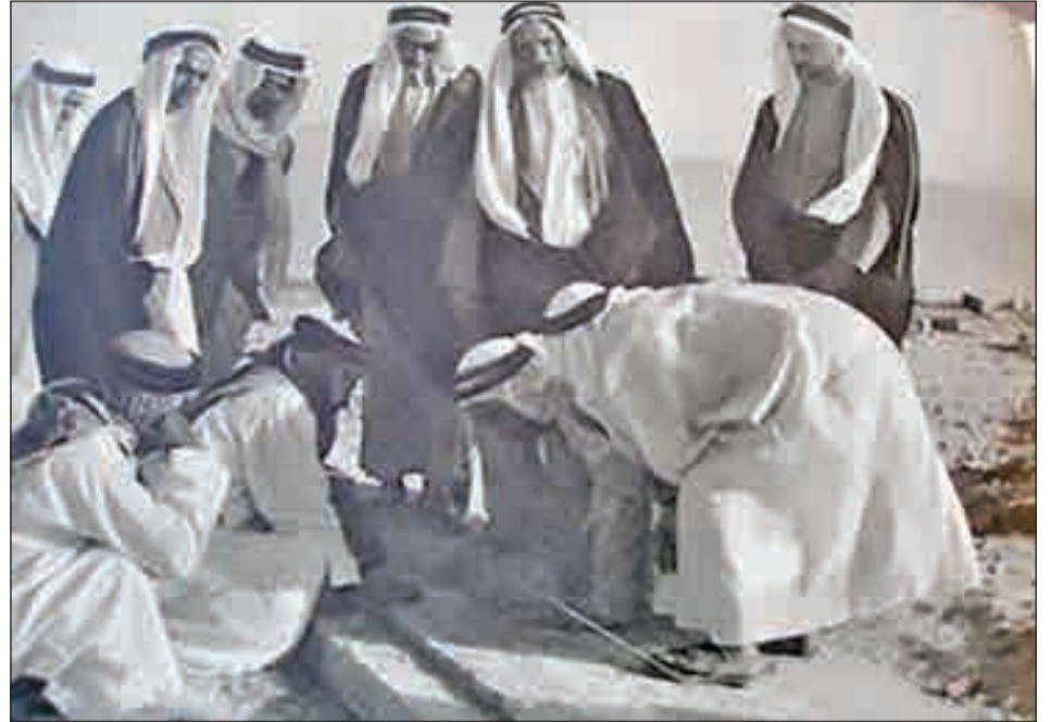
• وضع حجز الأساس لبناء الدور