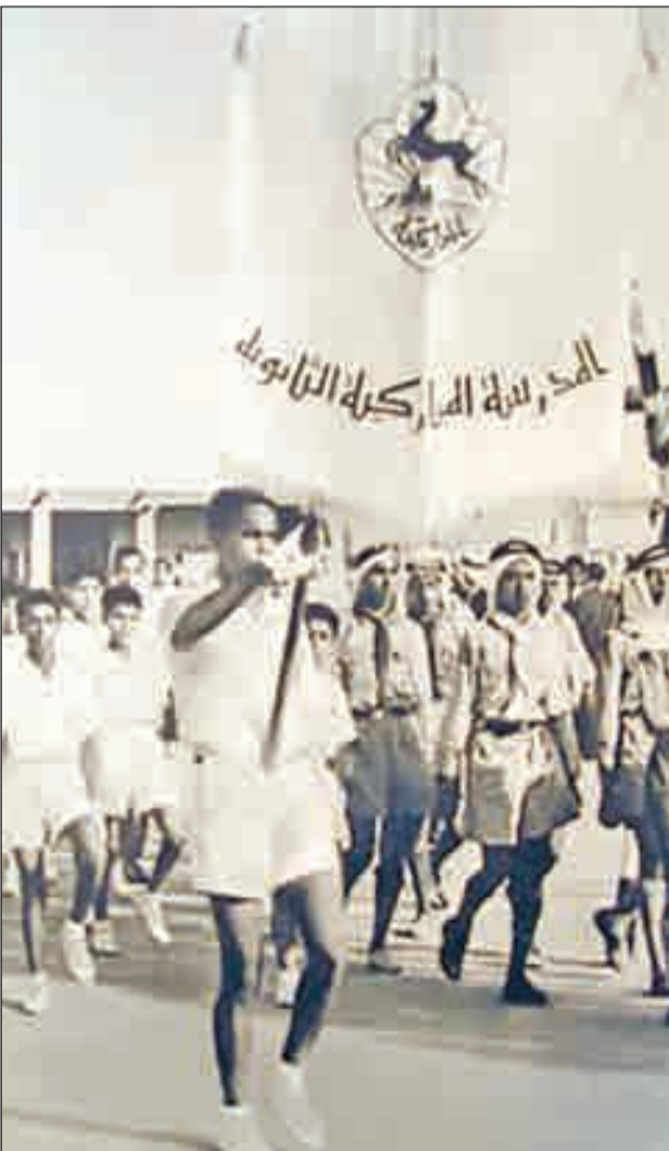
• طلاب المدرسة المباركية