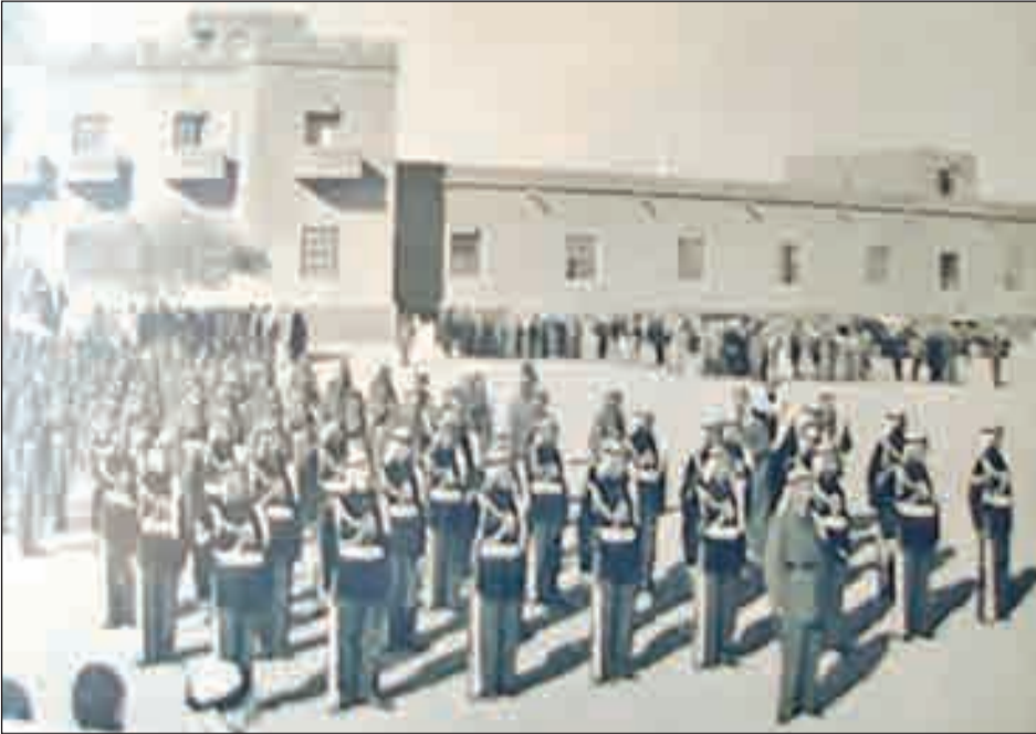
• تدريب ٣٠٠ شخص من رجال الشرطة